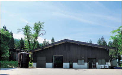
深沢原蒸溜所(長森Map 3ーは)

南魚沼市長森240-1 025-775-7115 (little M.) OPEN=10:00-17:00 定休日=火曜