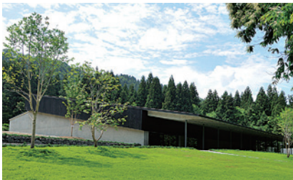
八海山雪室(長森Map 3ーろ)

南魚沼市長森426-1 025-775-2975 OPEN=10:00-17:00 入館料=無料 定休日=なし