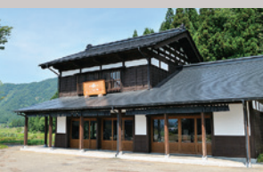
千年こうじや本店(長森Map 4ーに)

1543(天文12)年に創建されました。曹洞宗中魚沼郡千手長福寺末。1788(天明8)年現堂宇建立。麓に伝わる民話、弥三郎婆の菩提寺として伝わります。