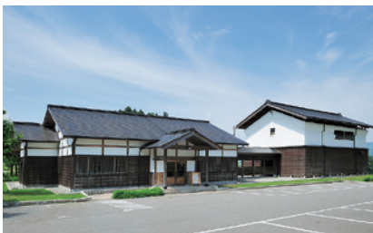
つつみや八蔵/八蔵資料館(長森Map 2ーは)

雪国・魚沼の豊かな自然や 魚沼の魅力を五感で味わっていただくための 空間です。https://www.uonuma-no-sato.jp/