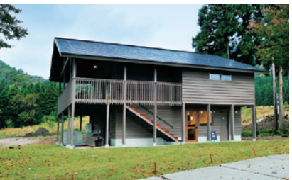
農園クラブハウス/ little M. (長森Map 1ーに)

お問合せ先:八海醸造お客様相談室 0800-800-3865 受付時間:平日9:00-17:00