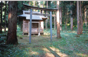
不動神社(長森Map 3ーは)

南魚沼市長森24 025-775-2419 OPEN=11:30-15:00 17:00-21:30(完全予約制) 不定休