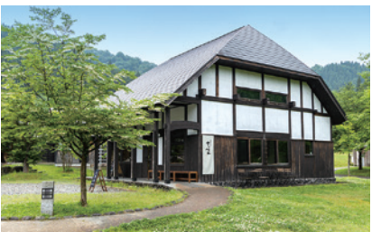
にぎりめし てっぺん(長森Map 2ーろ)

日本酒の副産物である酒粕を新鮮な状態から蒸溜させた本格粕取り焼酎や吟醸酒を思わせる香り高い醗から減圧蒸留した本格米焼酎、米を主原料とするライスグレーンウイスキーの蒸溜所です。焼酎や日本酒の原酒を使って梅酒の仕込みも行っています。※見学不可