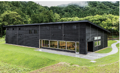
YUKIMURO WAGYU UCHIYAMA(長森Map 1ーは)

南魚沼市長森415-23 025-775-2800 OPEN=10:00-17:00 定休日=第2・第4火曜(12〜3月は毎週火曜)