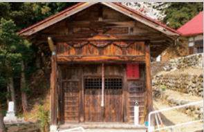
子安地蔵(長森Map 4ーは)

創建年不詳。長野県須坂市の古文書によると、1510(永正7)年6月の長森原の合戦の後、この神社にお参りし凱歌をあげたという記述が見られます。この地は船の形に似ていることから船山と呼ばれています。