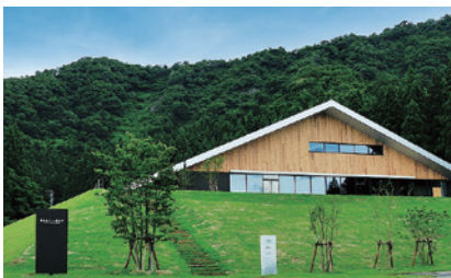
猿倉山ビール醸造所(長森Map 1ーろ)

南魚沼市長森459 025-775-7707 OPEN=10:00-17:00 定休日=なし 雪中貯蔵蔵見学ツアー(有料)要予約 ※詳細はHPをご覧ください