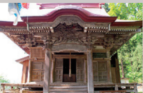
麓の地藏尊(麓の地藏様)(六万騎山Map)

通称“中通地藏様”創建年不詳。昭和末期まで善照庵入口にありましたが、土地改良のため、現在の地に移されました。本尊は延命地藏尊。