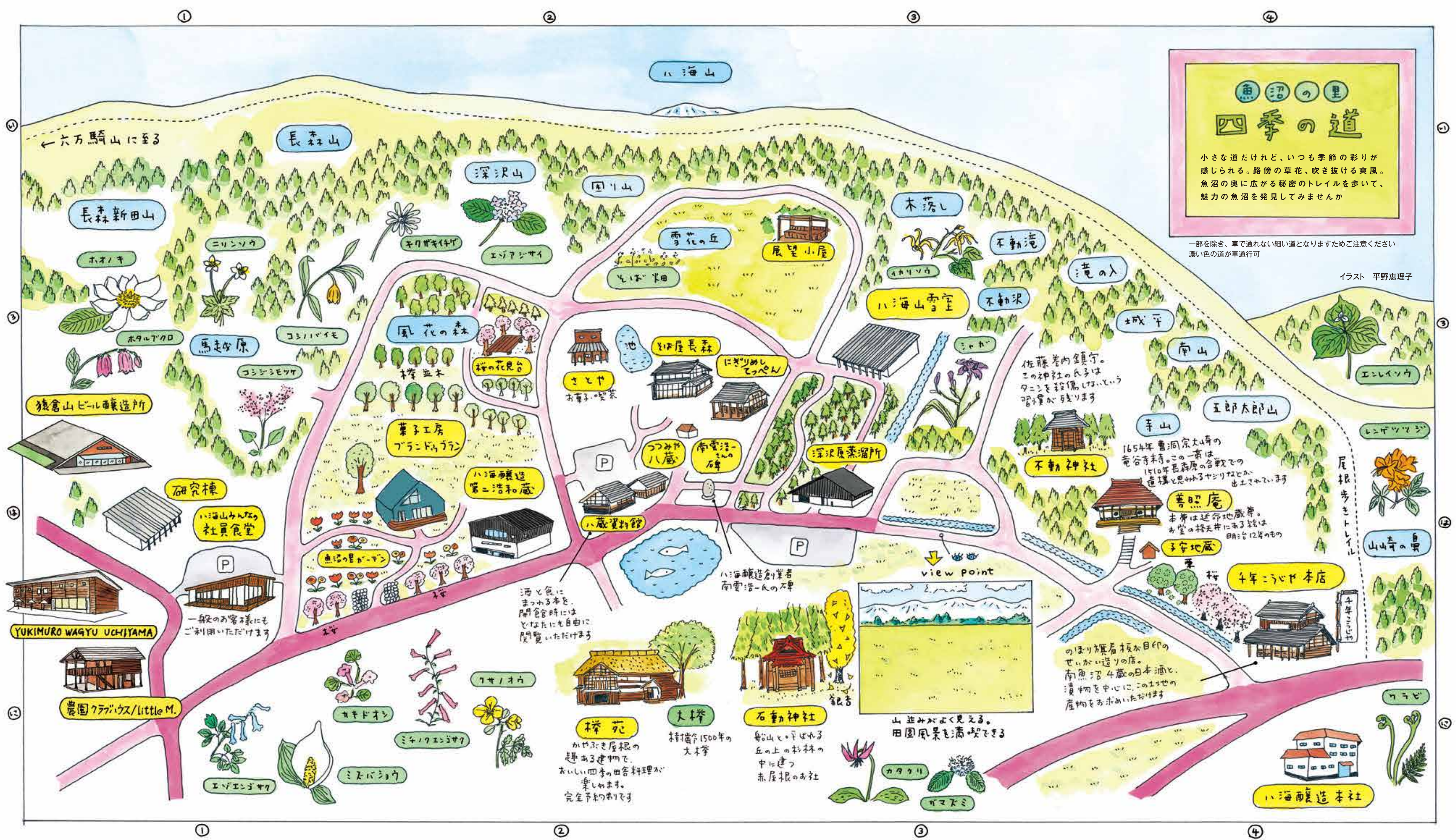
イラスト 平野恵理子