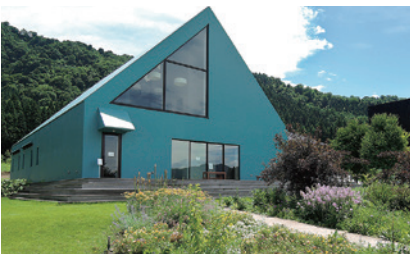
ブランドアップラン/ブランラボ(長森Map 2ーは)

新潟県南魚沼市長森233-1 025-788-0429 OPEN=ショップ10:00-17:00/レストラン11:00-15:00 定休日=火曜・水曜