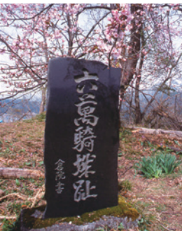
六万騎城趾の石碑