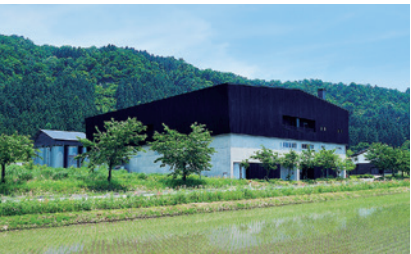
八海醸造第二浩和蔵(長森Map 2ーは)

南魚沼市長森193-1 025-775-7666 OPEN=10:00-17:00 定休日=なし