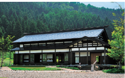
そば屋 長森(長森Map 2ーろ)

私たちは、ふだん飲む日本酒のスタンダード向上こそが、日本酒文化を広めることにほかならないと考えています。品質維持のために、手づくり麹、人の手による糶入れなど、愚直に回数を重ねて醸すという酒づくりをこの蔵で行っています。※見学不可