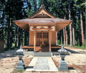
石動神社(長森Map 3ーに)

創建年不詳。長野県須坂市の古文書によると、1510(永正7)年6月の長森原の合戦の後、この神社にお参りし凱歌をあげたという記述が見られます。この地は船の形に似ていることから船山と呼ばれています。