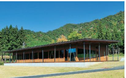
八海山みんなの社員食堂(長森Map 1ーは)

南魚沼市長森415-23 025-775-3887 OPEN=月〜金11:00-15:00(そばがなくなり次第終了) 土日 11:00-17:00(そばがなくなり次第終了) 定休日=なし